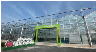
草莓組培室及高產種植基地