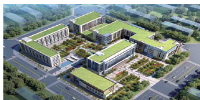
徐州雙碳技術產業園