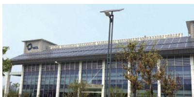
江蘇省硅基電子材料重點實驗室