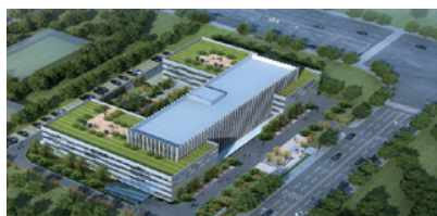
思慕譜環保科技產業園