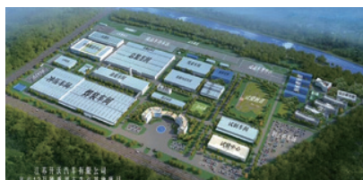
開沃新能源乘用車生產基地