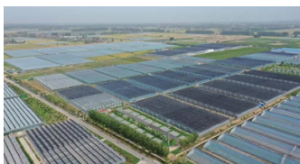
20萬平現代農業科技研發示範園

重點發展領域——主攻農副產品精深加工、綠色加工，引育研發倉儲物流、食品包裝檢測等服務機構，發展平臺電商等新業態，推動糧油產品、肉制品、保健食品、高端木制品在優勢區域重點領域突破發展，加快產品高端化、綠色化、品牌化進程，打造具有國內競爭力的食品及農副產品加工產業集群。